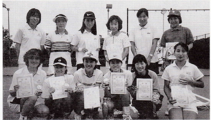
私たち卒業しました。