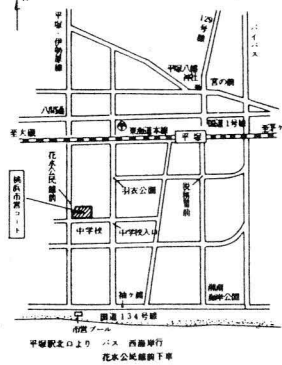
平塚市堂桃浜コート (クレークコート)