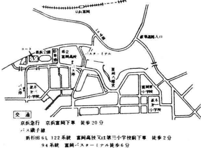
横浜市長浜テニスコート (オールウェザーコート)