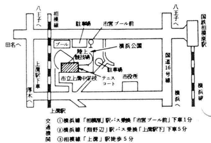
横浜公園テニスコート (クレークコート)