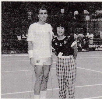
公開練習日に憧れのレンドルと

例えば最初の審判は女子連のブロックトーナメントの決勝戦、次はコカ・コーラ杯、そして10数年前からプロの試合の審判をするようになり、日本テニス協会の公認審判員の資格を取った後は、ちょうど国際テニス連盟(ITF)が審判員の資格制度を推進していた波に乗り、気が付いた時には日本に5~6人という“ブロンズバッヂ”の審判員として忙しく働くようになっていました。ここ数年、審判の世界でも“資格”という事が前面に出される事が多くなり、賛否両論ありますが、審判をしている人、目指している人には1つの目標になるかもしれません。